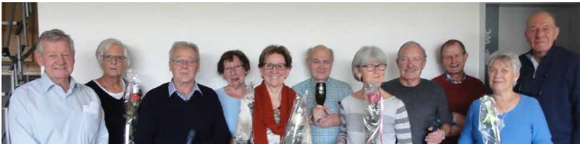
Die tüchtigen Helferinnen und Helfer beim Jahresschlussfest im Clubhaus