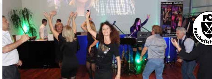
Ausgelassene Stimmung beim Tanzen