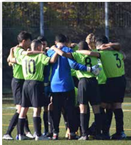
Teamgeist stärkt den Erfolg

Zum Schluss möchten wir uns bei unseren Junioren vom Ba bedanken für die gute Aufnahme im Team und den sehr guten Einsatz, den ihr bis jetzt geleistet habt. Wir sind überzeugt, dass wir gemeinsam eine sehr gute Rückrunde bestreiten werden und für die eine oder andere Überraschung noch sorgen werden.