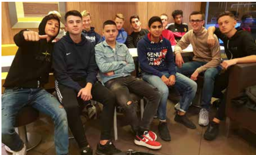
Motivierte Junioren auch neben dem Platz