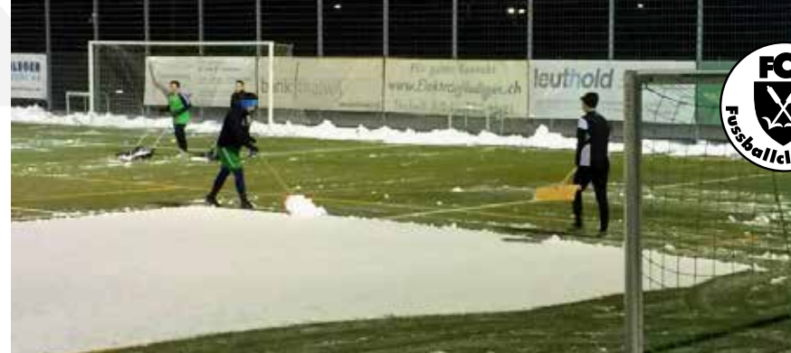
Training der anderen Art. Schneeschaufeln für einen freien, bespielbaren Fussballplatz