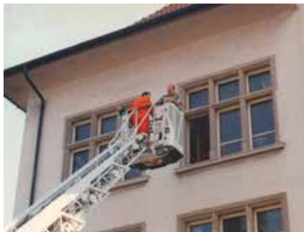
Feuerwehreinsatz in luftiger Höhe

Lieber Beat, es war sehr unterhaltsam mit Dir zu plaudern und wir wünschen uns FC Thalwiler, dass Du noch viele Jahre für uns im Einsatz sein wirst.