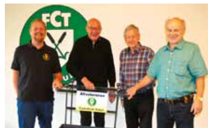
Oben: Finish für den Schirmständer... Unten: Übergabe an das Clubhaus