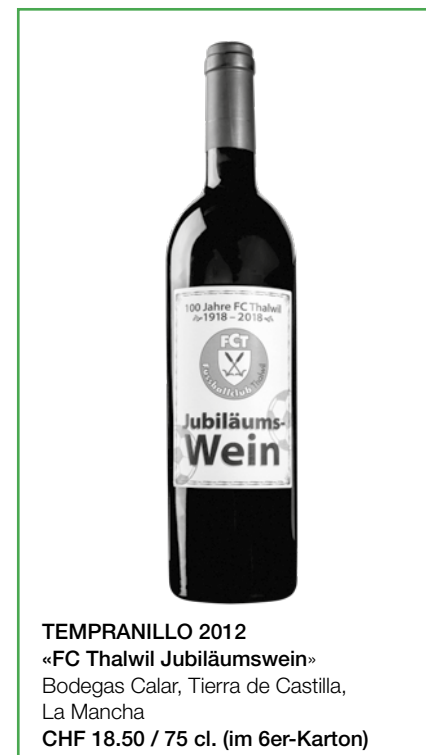
TEMPRANILLO 2012 «FC Thalwil Jubiläumswein» Bodegas Calar, Tierra de Castilla, La Mancha CHF 18.50 / 75 cl. (im 6er-Karton)