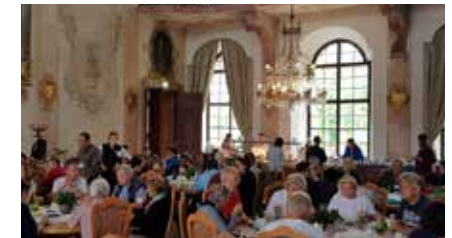
Frühstück im prunkvollen Festsaal von Schloss Leopoldskron

Am Freitag den 31. Mai 2019 trafen wir uns zum Frühstücksbuffet im Festsaal des Schloss Leopoldskron. Es war sehr eindrücklich in diesem riesigen Saal zu sitzen und wir fühlten uns erneut, wie Schlossherren! Anschliessend fuhren wir mit unserem Bus an den Rand der Altstadt von Salzburg, spazierten durch die Altstadt und sahen uns das Geburtshaus von Mozart an, übrigens ist der berühmte Dirigent Karajan auch aus Salzburg.