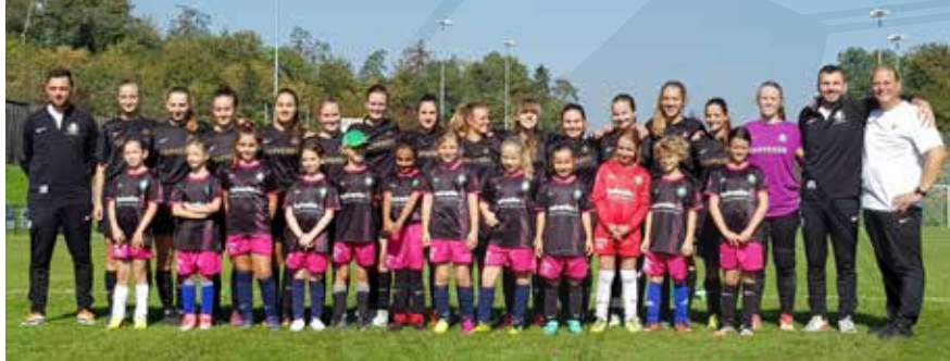
Juniorinnen des FC Thalwil